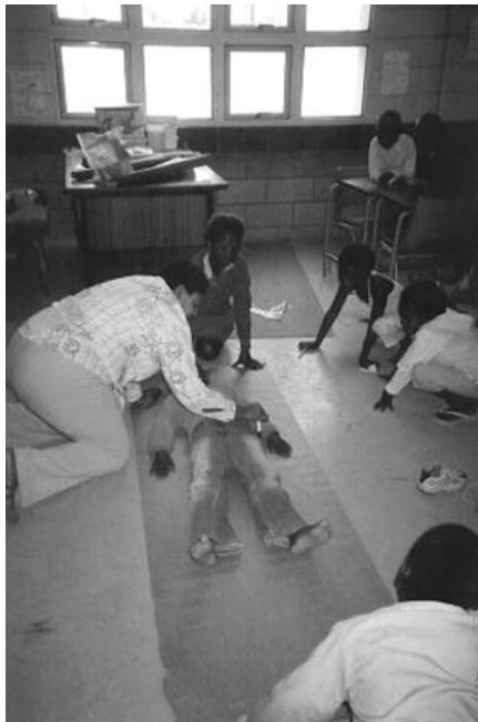
Toepassing van liggaamsportrettegniek in groepsverband

Wat die wyse van toepassing betref, het die deelnemende opvoeders die liggaamsportrettegniek skynbaar op unieke wyse geïmplementeer in 'n poging om, onder andere, leerder-identiteite uit te brei. Aangesien die deelnemers aan ons studie liggaamsportrette gevolglik in klasverband gebruik het (en die hele klas soms aan die proses deelgeneem het), het sommige leerders bemoedigende boodskappe op die liggaamsportrette van ander geskryf. Op hierdie wyse is empatie, 'n nabyheid tussen leerders en ondersteuningsnetwerke binne klasverband gestig. Foto 3 illustreer die toepassing van die liggaamsportrettegniek in groepsverband.