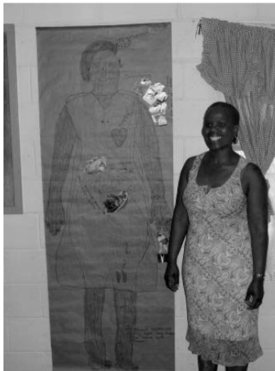
Deelnemer gebruik haar eie liggaamsportret as voorbeeld

volg gerapporteer oor haar poging om die tegniek by graad een-leerders te gebruik: "... about the body map, I'm being honest...I didn't know how to explain it to them ...I wanted to explain it but I have no words to explain it, they are too young...all of them".