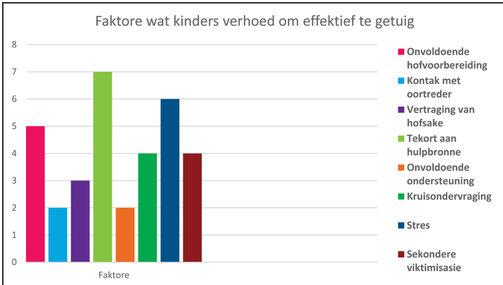
Figuur 2: Grafiese opsomming van faktore